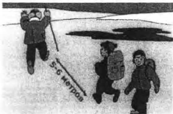
В случае движения группы по льду соблюдайте дистанцию 5-6 м

- Если Вы передвигаетесь группой, то двигаться нужно друг за другом, сохраняя интервал не менее 5 - 6 метров, также необходимо быть готовым оказать помощь товарищу.